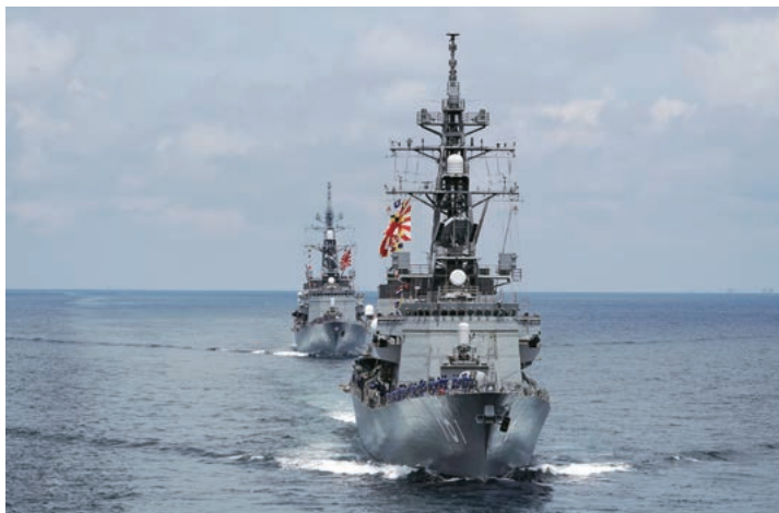
ブルネイ沖を航行する海上自衛隊の護衛艦(2019年6月)

2019年、日本は厳しい安全保障環境に直面している。北東アジアでは、北朝鮮の核、ミサイル問題、東シナ海での中国による現状変更の試み、さらに、日米同盟の管理や日韓の対立、ロシアとの外交交渉など、課題は山積している。しかし、外交的視野を北東アジアの外に広げると、国際秩序をめぐる大きな地殻変動が生じている。日本の将来にとって、21世紀の経済的発展の中心となるアジア地域において、国際秩序をめぐる変化を適切に理解し、自らの国際秩序構想を描き、その実現に向けて行動することは、近隣諸国との外交問題と同等かそれ以上の重要課題であろう。