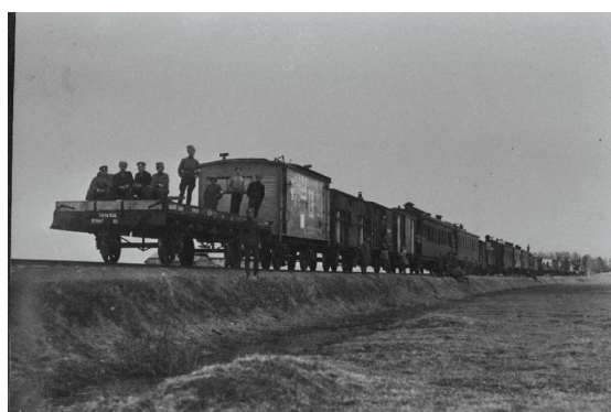
「独立戦争」期に用いられた装甲列車 5

転機となったのは第一次世界大戦の終了であった。ドイツの敗北に伴って、エストニア共和国臨時政府が速やかに再建されたのである。しかし、政府は直ちに問題に直面する。すなわちドイツ敗北後もなお存在するドイツ側「義勇軍」、ソヴィエト＝ロシアの支援を受け、エストニアでのポリシェヴィキ政権樹立を目指す「赤軍」への対処であった。1918年末に赤軍の進軍によって始まった一連の戦いは「独立戦争（Vabadussõda）」と呼ばれる 4 。