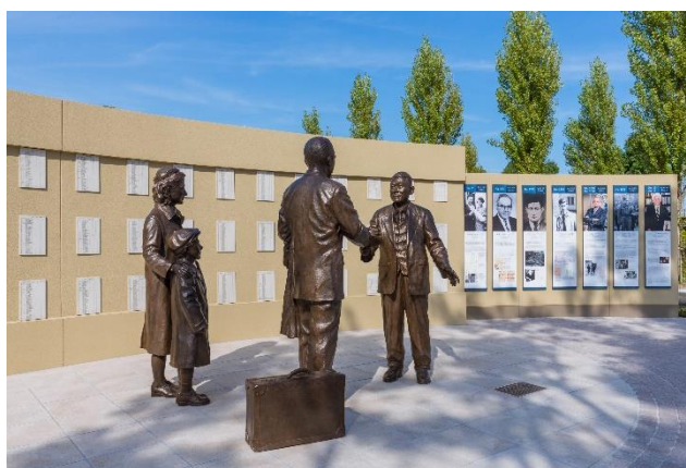
杉原千畝広場 (名古屋市瑞穂区)

40年10月から41年春にかけて、2200～2300名のユダヤ難民が通過ヴィザを持ってウラジオストク経由で敦賀に到着した。多くは神戸ユダヤ人協会の助けもあって神戸に住みついた。第三国の入国ヴィザを有している者は目的国へ渡航できたが、ヴィザのない1千名余は米ユダヤ基金の支援を受けつつ神戸での滞留を余儀なくされた。41年7月の日本の仏領インドシナ南部への進駐を契機に、アメリカは日本に対して石油の禁輸を断行し、支援金の送金手続きも禁止した。日本政府は治安・国防上の理由から残った難民全員を日本軍支配下の上海に移送する。上海のユダヤ難民は、日本軍によって居住や移動が制限され、過酷な状況下で戦時中を過ごした。戦後、アメリカ・カナダ・オーストラリア・パレスチナなどに定住先を見つけ、旅立って行った。